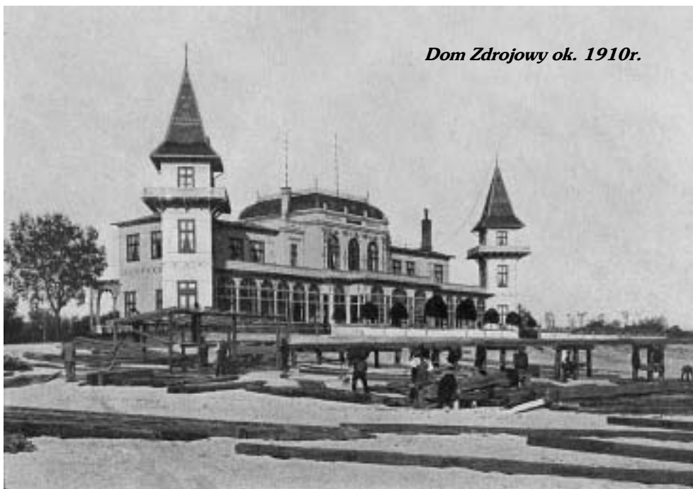
Dom Zdrojowy ok. 1910r.

Trzymając się ścieżki biegnącej wzdłuż brzegu morskiego wychodzimy z parku na otwartą przestrzeń. Idziemy Falochronem Zachodnim wzdłuż płotu Wolnego